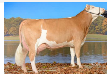
Ćerka Sibilla AT 800.795.117

Boja tela: 33% crvena, 29% tamnocrvena, 25% tamnožuta, 13% žuta